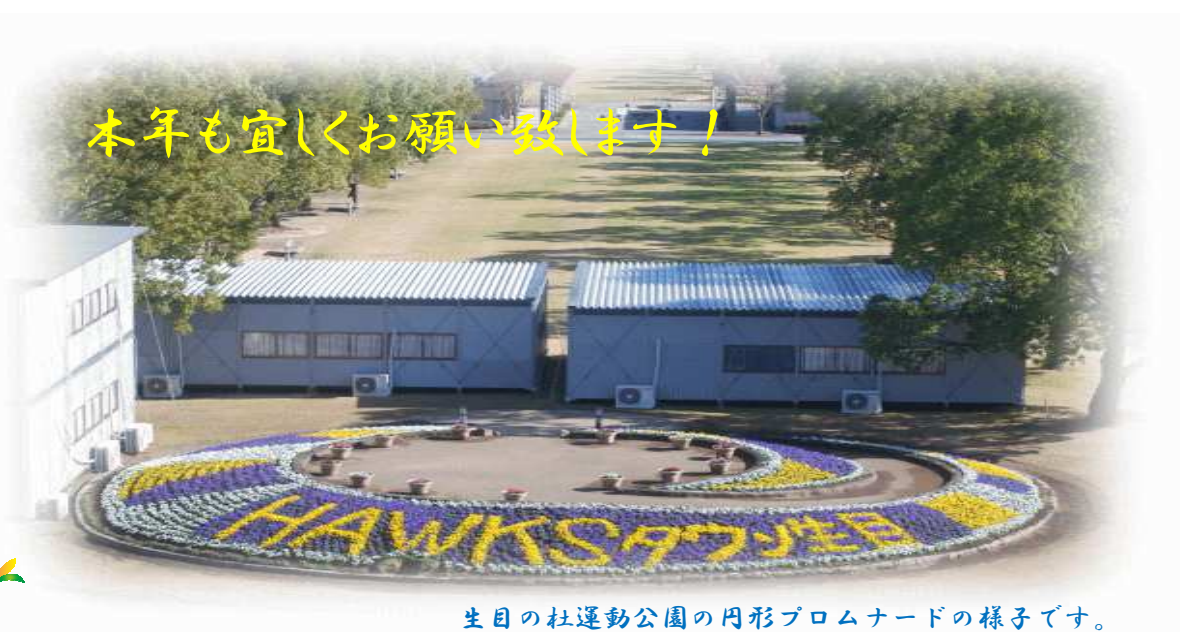
生目の杜運動公園の円形プロムナードの様子です。