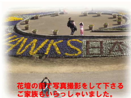
花壇の前で写真撮影をして下さるご家族もいらっしゃいました。