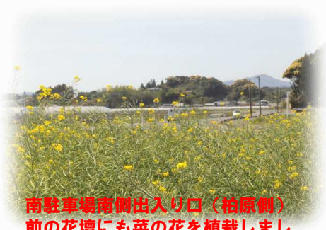
南駐車場南側出入口（柏原側）前の花壇にも菜の花を植栽しました。