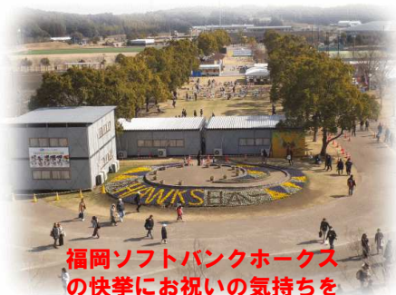
福岡ソフトバンクホークスの快挙にお祝いの気持ちをこめて植栽した花壇です。