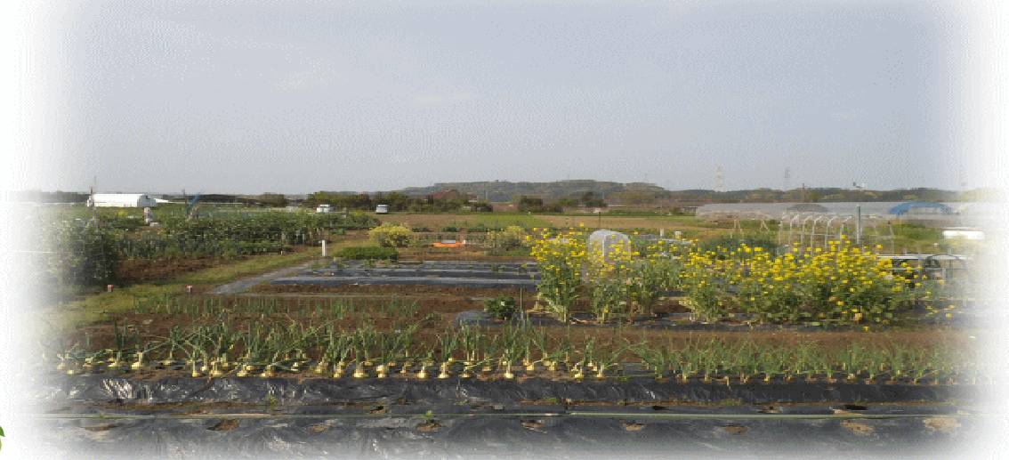
4月の第3市民農園の様子です。