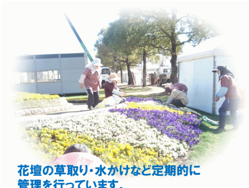
花壇の草取り・水かけなど定期的に管理を行っています。