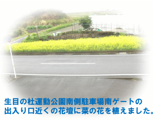
生目の杜運動公園南側駐車場南ゲートの出入り口近くの花壇に菜の花を植えました。